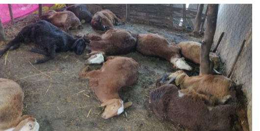
నుంచి తగిన ఆర్థిక సహాయం అందేలాచర్యలు తీసుకోవాలని గ్రామస్థులు కోరుతున్నారు.