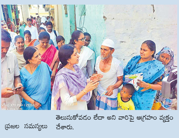
తెలుసుకోవడం లేదా అని వారిపై ఆగ్రహం వ్యక్తం చేశారు. ప్రజల సమస్యలు

కడప, మే 4 ఆంధ్రప్రగతి పులివెందుల నియోజకవర్గంలో ఎన్నికల ప్రచారం చేస్తున్న సీఎం జగన్ సతిమణి భారతి స్థానిక ప్రజలు తనకు బ్రహ్మరథం వడతారని భావిస్తే.. ప్రతి ఇంటి వద్ద సమస్యలు ఏకరూపు పెడుతున్నారు. దీంతో ఉక్కిరిబిక్కిరి అవుతున్న ఆమె స్థానిక వైసీపీ నేతలకు క్లాస్ తీసుకున్నారు. 'మీరంతా ఏం చేస్తున్నారు. పింఛన్లు, ఇళ్ల స్థలాలు ఎవరికి అవసరమో గుర్తించలేని స్థితిలో ఉన్నారా' అంటూ మండిపడ్డారు. భారతి ప్రచారానికి వెళ్లివచ్చు.. 'మాకు ఒక్క పథకమూ అందలేదు.. మా ఇంట్లో 5 ఓట్లు ఉన్నాయి. మీకు ఓటు వేయం' అని ఓ మహిళ ఆమె ముందే తెగేసి చెప్పారు. మరో