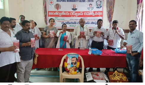
రెడ్ క్రాస్ పుట్టుక గురించి తెలియజేస్తూ మొదటి ప్రపంచ యుద్ధం తర్వాత రెడ్ క్రాస్ శాంతిని పెంపొందించడంలో గణనీయమైన కృషి చేసింది. 1864లో క్రాస్ ప్రారంభమైంది. 157 ఏళ్ల క్రితం 12 దేశాలు ఈ సంస్థను నెలకొల్పాయి. ప్రపంచ యుద్ధాల సమయంలో ఈ సంస్థ సేవలకుగాను మూడుసార్లు నోబెల్ శాంతి బహుమతి వరించింది. యుద్ధ ప్రాంతంలో గాయపడిన సైనికుల ఆరోగ్య పరిస్థితిని మెరుగుపరచడానికి జెనీవాలోని హెలాల్లో 12 దేశాల మధ్య ఒప్పందం కుదిరింది. దీనిని మొదటి జెనీవా సమావేశం అంటారు. 1934లో టోక్యోలో జరిగిన 15వ అంతర్జాతీయ సదస్సులో యుద్ధ సమయంలో గాయపడిన సైనికులను రక్షించేందుకు గాయపడిన సూచనలతో రెడ్ క్రాస్ ట్రూస్ నివేదికను సమర్పించారు. ఈ ప్రతిపాదన తర్వాత 1946లో రెండవ ప్రపంచ యుద్ధం సమయంలో అమలులోకి వచ్చింది. 1948లో రెడ్ క్రాస్ సొసైటీల లీగ్ గవర్నర్స్ బోర్డు రెడ్ క్రాస్, ఇంటర్నేషనల్ కమిటీ స్థాపకుడు హెన్రీ ద్యూసంట్ జన్మదినం రోజున 'రెడ్ క్రాస్ డే' జరుపుకోవాలని ప్రతిపాదించింది ఐ సి ఆర్. అప్పటి నుంచి ఏటా మే 8న ప్రపంచ రెడ్ క్రాస్ దినోత్సవాన్ని జరుపుకుంటున్నారు.