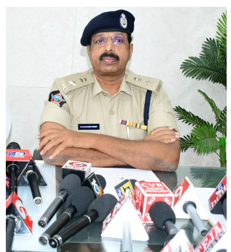
9). సోషల్ మీడియాలో వచ్చే ఊహానిత వార్తలను నమ్మి ఎట్టి పరిస్థితుల్లో వాటికి స్పందించరాదు, మరియు సోషల్ మీడియాలో రెచ్చగొట్టే ప్రకటనలు మరియు పోస్టులు పెట్టి ఏదైనా గొడవలకు కారణమైతే వారిపై కఠినమైన చర్యలు

లోపలికి అనుమతించడం జరుగుదు. 4). ఎన్నికల కౌంటింగ్ కు వచ్చేవారు మొబైల్స్ ఇతర ఎలక్ట్రానిక్ పరికరాలు మరియు అగ్నిపెట్టెలు సిగరెట్లు ఎట్టి పరిస్థితుల్లో తీసుకురాకూడదు. 5). ఏజెంట్లు ఒక్కసారి కౌంటింగ్ కేంద్రం లోపలికి వెళ్లిన తర్వాత కౌంటింగ్ పూర్తి అయ్యేవరకు బయటకు వెళ్లడానికి వీలు లేదు ఏదైనా అనారోగ్య సమస్యలు ఉంటే ముందుగానే వాటికి సంబంధించిన మందులు వెంట తెచ్చుకోవాలి. 6). ఎన్నికల ఫలితాలు వెలువడిన తర్వాత విజయోత్సవ ర్యాలీలు, క్రాకర్స్ (టపాకాయలు) కాల్చటకు అనుమతిలేదు. 7). టపాసులు మరియు ఇతర పేలుడు పదార్థాలను ఎక్కడ కూడా నిలువ ఉంచుకోకూడదు. నిబంధనలను ఉల్లంఘిస్తే చర్యలు తప్పవు. 8). మీ నియోజకవర్గము నుండి ఏజెంట్లు తప్ప మిగిలిన వారు ఎవరూ కూడా మండలం కేంద్రం కు కానీ, నియోజకవర్గ కేంద్రానికి కానీ, జిల్లా కేంద్రానికి కానీ మరియు కౌంటింగ్ కేంద్రం వద్ద కానీ తీసుకొని రాకూడదు.