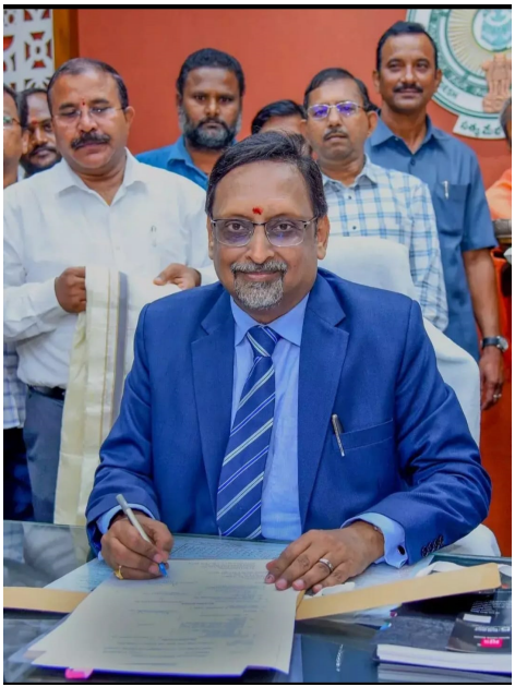
బాధ్యతలు స్వీకరించిన పదవ ఆయన మాట్లాడుతూ ముందుగా సిఎన్ గా పనిచేసే అవకాశం కల్పించినందుకు ముఖ్యమంత్రిగా ప్రమాణం స్వీకారం చేయనున్న ఎన్.చంద్రబాబు నాయుడు వారికి కృతజ్ఞతలు తెలిపారు. సహచర కార్యదర్శులు, శాఖాధి పతులు, ఇతర