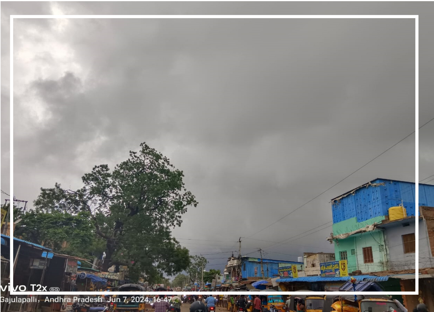
Gajulapalli, Andhra Pradesh Jun 7, 2024, 16:47

మహానంది మండలం గాజులపల్లె గ్రామంలో ఉన్నట్టుండి ఒక్కసారిగా వాతావరణం మారిపోయింది. శుక్రవారం మృగశిర కార్తి ప్రారంభం అవడంతో సాయంత్రం ఒక్కసారిగా ఆకాశంలో కారుమబ్బులు కమ్ముకున్నాయి. ఒక్కసారిగా నల్లటి కారుమబ్బులతో చీకటి వాతావరణం నెలకొంది. ఉన్నట్టుండి ఒక్కసారిగా ఆకాశంలో కారు మబ్బులు అలుముకునీ చిరుజల్లులు కురుస్తున్నాయి. దీంతో ప్రజలంతా ఇళ్ళల్లోనుంచి బయటికి వచ్చి చల్లటి వాతావరణాన్ని ఆస్వాదిస్తున్నారు. కొద్ది నిమిషాల పాటు చోటుచేసుకున్న ఘటన ప్రజలను విశేషంగా ఆకట్టుకుంది. వాతావరణంలో మార్పు కారణంగా రైతాంగం ఆనందం వ్యక్తం చేస్తున్నారు. ఉరుములు, మెరుపులతో భారీ వర్షాలు కురిసే సూచనలు కనిపిస్తున్నాయి.