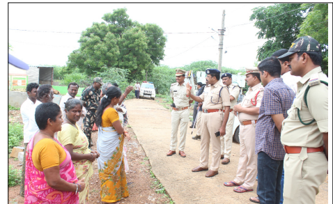
గౌడవలకు గల కారణాల గురించి విచారణ చేయడం జరిగింది. అనంతరం రెండు వర్గాలకు చెందిన కుటుంబాల వారితో మాట్లాడుతూ.. మీరు ఎలాంటి గౌడవలకు విభేదాలకు వెళ్లకూడదని, ఒక్కసారి ఏదైనా జరగకూడదని జరిగి నష్టపోతే కుటుంబం మొత్తం ఇబ్బందుల్లో పడే అవకాశం ఉంటుందని, మీకు ఏదైనా సమస్య ఉంటే పోలీస్