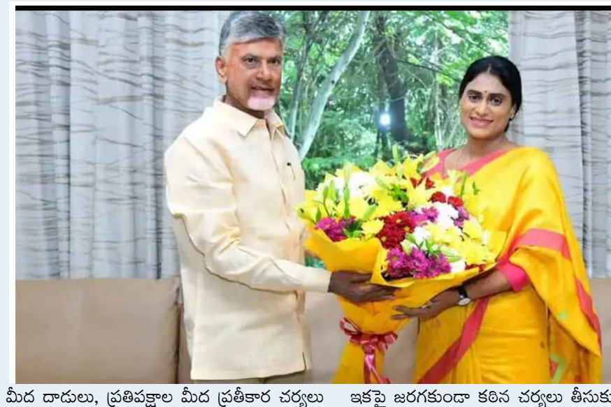
మీద దాడులు, ప్రతిపక్షాల మీద ప్రతీకార చర్యలు ఇకపై జరగకుండా కఠిన చర్యలు తీసుకుంటారని

వారు చేసారని మీరు, మీరు చేసారని భవిష్యతులో మళ్ళీ వాళ్ళు, ఇలా ఈ వగలకు, ప్రతీకారాలు అంతు ఉండదు, సభ్యసమాజంలో, ప్రజాస్వామ్యంలో వీటికి చోటు లేదు, ఉండకూడదు. ఎన్నో తీవ్రమైన సవాళ్ళ మధ్య రాష్ట్ర పునర్నిర్మాణం వేగంగా, నిబద్ధతతో జరగాల్సిన ఈ సమయంలో, ఇటువంటి హేయమైన చర్యలు, దాడులు, శాంతిభద్రతలకు మాత్రమే కాదు, రాష్ట్ర ప్రగతికి, పేరుకు, అందివచ్చే అవకాశాలకు కూడా తీవ్రమైన విఘాతం కలగజేస్తాయని తెలియజేస్తున్నాము. గడచిన ఐదేండ్లలో జరిగిన విశ్వంఖల పాలన, దానివలన అన్ని విధాలుగా నాశనమైన రాష్ట్రాన్ని మళ్ళీ గాడిలోపెట్టి ముందుకు తీసుకునివెళతారని ప్రజలు మీకు ఈ తీర్పు ఇచ్చారు. దానికి అనుగుణంగా నడుచుకుని, వైస్సార్ గారి విగ్రహాల