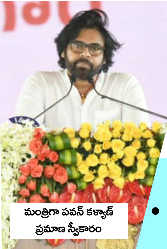
మంత్రిగా పవన్ కళ్యాణ్ ప్రమాణ స్వీకారం