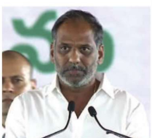
గొట్టిపాటి రవి (కమ్మ)