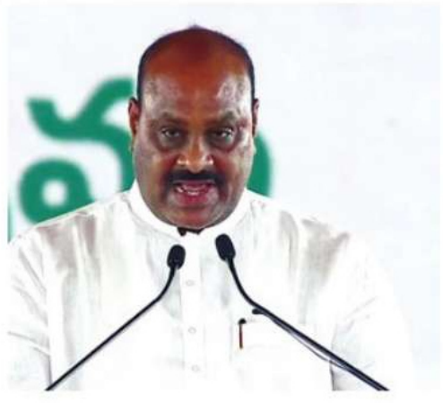
కింజరాపు అచెన్నాయుడు (బీసీ, కొప్పల వెలమ)