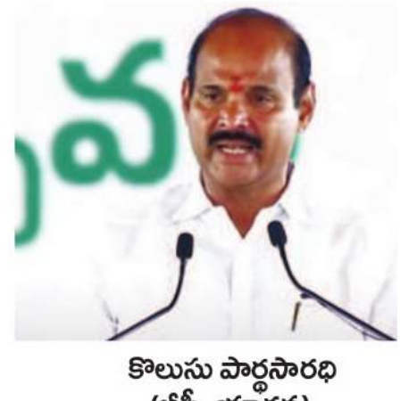
కొలుసు పార్థసారథి (బీసీ, యాదవ)