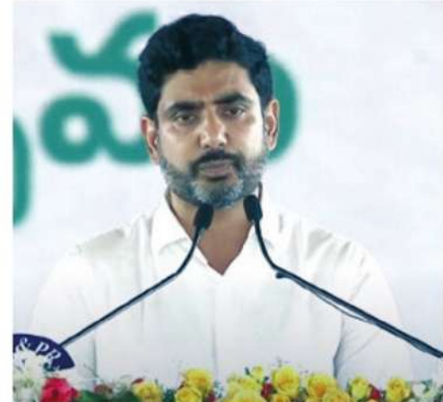
నారా లోకేశ్ (కమ్మ)