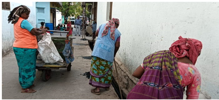
ఆంధ్ర ప్రగతి నంద్యాల జూన్ 12:

నంద్యాల మున్సిపాలిటీలో వివరాలు గోప్యం, గోప్యం, మీడియా, కౌన్సిలర్స్ అడిగినా వివరాలు గోప్యంలో ఉంచడంలో మర్కం దేవుడికే తెలియాలి. అయిదు ఏళ్లలో దాదాపు 100 మందిని పనిలోనికి తీసుకున్నట్లు సమాచారం. విధంగా ఈ ఊరి వారిలో 34 మంది రెండునెలల క్రితం చేరిన వారి పేర్లు, సెల్ నెంబర్లు మీరే గమనించండి. ఇలా దాదాపు నూరు మందిని చేరినా వారు ఎక్కడ పనిచేస్తున్నారు, వారి వివరాలు అడిగితే అంతా గోప్యం, సార్వత్రిక ఎన్నికలకు