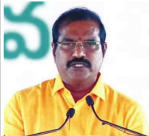
నిమ్మల రామానాయుడు (కాపు)