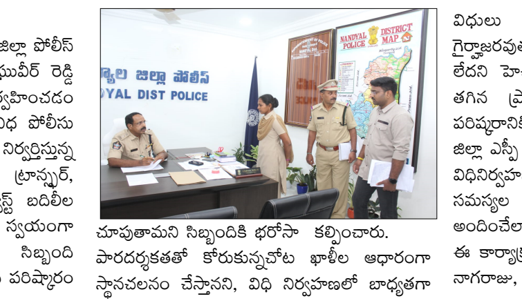
మాపుతామని సిబ్బందికి భరోసా కల్పించారు. పారదర్శకతతో కోర్టునుచోట ఖాళీల ఆధారంగా స్థానచలనం చేస్తానని, విధి నిర్వహణలో బాధ్యతగా