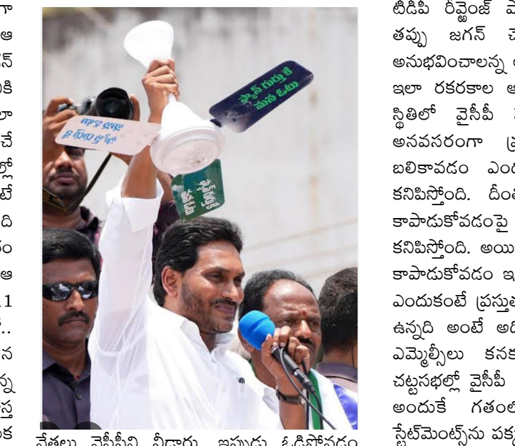
నేతలు వైసీపీని వీడారు. ఇప్పుడు ఓడిపోవడం..

ఎమ్మెల్యేలపైకి షిఫ్ట్ చేశారు జగన్.. వారితో భేటీ నిర్వహించారు. పోరాటం అప్పుడే అయిపోలేదు అని పాత భోధ చేశారు. వైసీపీ నేతలను కంగారు పెట్టే మరో అంశం రెడ్ బుక్.. విపక్షంలో ఉన్నప్పటి నుంచి ఈ రెడ్ బుక్ అంశాన్ని ప్రజల్లోకి తీసుకెళ్లారు లోకేశ్. చట్ట విరుద్ధంగా ప్రవర్తించిన ఒక్కో నేత, అధికారి పేరును తాను నోట్ చేసుకున్నానని అధికారంలోకి రాగానే అందరిపై చర్యలు తీసుకుంటామన్నారా.. సో ఇప్పుడు కూడా అదే మాట చెబుతున్నారు.. రెడ్ బుక్ నేత పని తాను చేసుకుపోతుందన్నారు. అంతేకాదు తాము చాలా సయమనంగా వ్యవహరిస్తున్నామంటున్నారా లోకేశ్. కానీ టీడీపీ మాత్రం పక్కా ప్లానింగ్ తో ముందుకు వెళుతున్నట్టు కనిపిస్తుంది. సామ, దాన, బేధ, దండోపాయాలు అన్నట్టుగా వైసీపీని చుట్టుముడుతోంది. ఇటు ప్రజల్లో ప్రభుత్వంలో ఉన్నప్పుడు తీసుకున్న నిర్ణయాలు.. చేసిన పనులను ప్రజల్లో తీసుకున్న నిర్ణయాలు.. కేసుల చిక్కులను సిద్ధం చేస్తోంది. అయితే.. ఇది అరంభం మాత్రమే.. ముందు ముందు ఫ్యాన్ పార్టీకి భరించలేనంత ఉక్కపోత ఖాయం.