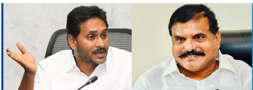
ఆంధ్ర ప్రగతి అమరావతి ఆగస్టు 02: