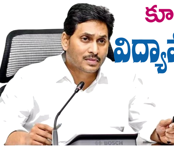
ఆంధ్ర ప్రగతి శాడేపల్లి ఆగస్టు 30: