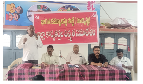
కేంద్రంలోని బిజిపి ప్రభుత్వం రాష్ట్రంలో నష్టపోయిన రైతాంగాన్ని, ప్రజలను ఆదుకునేందుకు వివేకానందం కింద నిధులను విడుదల చేయాలని అన్నారు. అదేవిధంగా నంద్యాల జిల్లాలోని చామకాలవ, కుందునది, మద్దిలేరు వాగు, తెలుగుగంగ, కెసి కెనాల్ లు నిండిపోయి వాటి ద్వారా నష్టపోయిన ప్రజలను ఆదుకోవాలని, భవిష్యత్తులో వరదల నుండి నష్టపోకుండా ప్రత్యేకమైన చర్యలు చేపట్టాలని అన్నారు. వరదలు వచ్చిన ప్రతిసారి నంద్యాల పట్టణమంతా పూర్తిగా నిండిపోయిన ప్రజలు తీవ్రంగా నష్టపోతున్నారని, వెంటనే రాష్ట్ర ప్రభుత్వం నుండి చామకాలవ, కుందునది, మద్దిలేరువాగుల వెంట రక్షణ గోడను నిర్మించాలని, గతంలో నిధులను కేటాయిస్తే వాటిని ఉపయోగించడంలో ప్రజాప్రతినిధులు ఘోరంగా