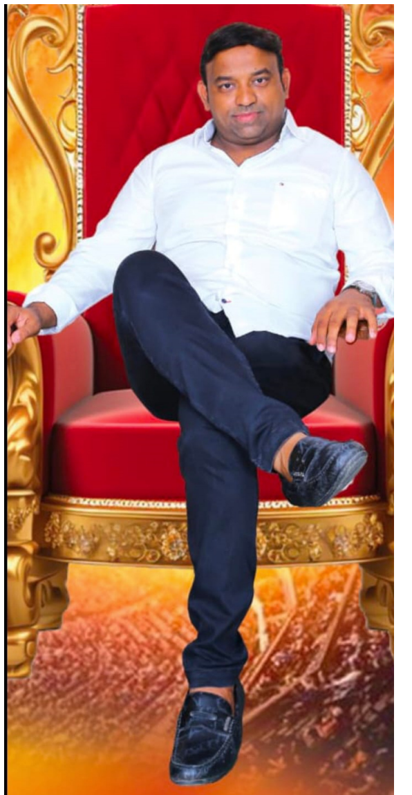
సంపాదించారు,అస్తితో పాటు నిజాయితీ బతకాలని పెద్దలు చెప్పారు.కోట్లాది రూపాయల స్థలాలు పెద్దవారు ప్రజల కోసం ఇస్తున్నా ఏ నాడూ కుటుంబసభ్యులు భద్రపడిన దాఖలాలు లేవని ,దబ్బు,స్థలాలు కంటే ప్రజల అభిమానం,ఆశీస్సులు ముఖ్యమని భావించి నశ్యం కుటుంబానికి జై కొట్టాల్సిందే.