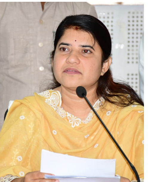
హెల్త్ భూముల పరిశీలన ప్రారంభించామని... ఎక్వైటే రిజిస్ట్రేషన్ జరిగిందో సంబంధిత భూములను రీ వెరిఫై చేసి సంబంధిత నివేదికలను సమర్పించాలని జాయింట్ కలెక్టర్ మండల తాసిల్దారులను ఆదేశించారు. మండలంలో భూములను క్రయ విక్రయాలు జరిపినా, మైగ్రేట్ చేసినా సంబంధిత భూములన్నింటినీ పరిశీలించాలన్నారు. భూములకు సంబంధించిన ప్రతి లావాదేవీలు క్లీయర్ గా ఉండాలని రెవిన్యూ అధికారులను ఆదేశించారు.