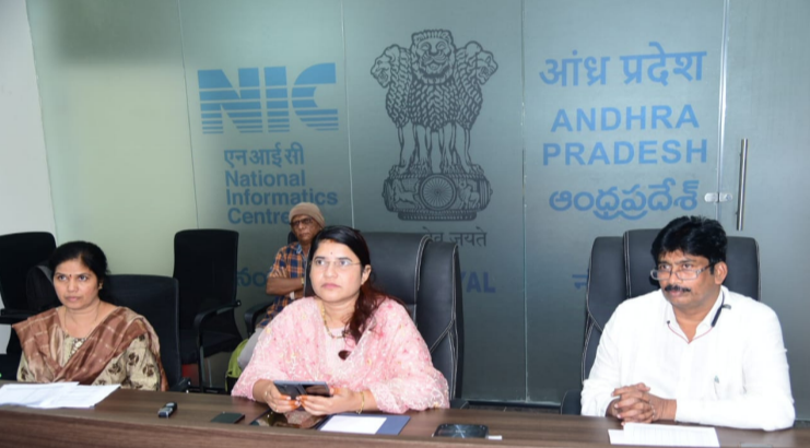
కాదు వెంటబడి పనులు చేయించాలని కలెక్టర్ ఆదేశించారు. 25 అంగన్వాడీ కేంద్రాలలో టాయిలెట్లు అవసరంలేదని చెప్పినారని వేరే అంగన్వాడీ కేంద్రాల్లో నిర్మించేందుకు ప్రతిపాదనలు పంపాలని కలెక్టర్ సంబంధిత సిడిపిఓలు ఆదేశించారు. 101 సాక్ష్యం అంగన్వాడీలకు 10 వేల రూపాయలు పోషక విలువలకు, 16 వేల రూపాయలు రూఫ్ వాటర్ హార్వెస్టింగ్ డ్రైవర్ల నిర్మాణాలకు, 19,800 రూపాయలు అంగన్వాడీలలో మౌలిక వసతులకు కేంద్ర ప్రభుత్వం మంజూరు చేసిందన్నారు. మంజూరైన అంగన్వాడీ కేంద్రాలలో సంబంధిత పనులు క్షేత్రస్థాయిలో అమలు కావాలని... తాను స్వయంగా పరిశీలిస్తానని కలెక్టర్ తెలిపారు. రూఫ్ వాటర్ హార్వెస్టింగ్ డ్రైవర్ల నిర్మాణాల పనులను ఆర్డర్లపై శాఖకు అప్పగించాలని కలెక్టర్ ఐసిఐఎస్ పిడిని ఆదేశించారు.