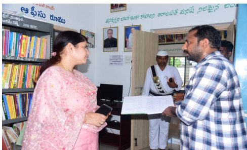
అవ్వడానికి అవసరమయ్యే కంప్యూటర్ సిస్టంలను కూడా ఏర్పాటు చేసుకోవాలని కలెక్టర్ ఆదేశించారు. గ్రంథాలయ భవనం పాక్షికంగా దెబ్బతినిందని, ప్లూరింగ్ కూడా మరమ్మత్తులు చేయాల్సి ఉందని సంబంధిత పనులు పూర్తి చేసుకోవాల్సిందిగా కలెక్టర్ ఆదేశించారు.