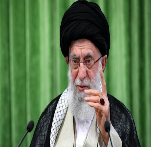
టిప్రూన్: ఇజ్రాయేల్ దాడిలో హమాస్ నేత యాహ్యూ సిస్వర్ మృతి చెందినప్పటికీ హమాస్ ఉనికి విషయంలో ఎటువంటి సమస్య లేదని ఇరాన్ సుప్రీం లీడర్ అయతొలా అలీ ఖమేనే అన్నారు. ఆయన