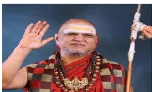
తిరుమల కొండపై నిబంధనలకు విరుద్ధంగా శారదాపీఠం చేపట్టిన నిర్మాణంపై చర్యలు తీసుకోవాలని టీడీపీని ఆదేశించింది.

లక్షల నామమాత్రపు ధరకు శారదా పీఠానికి గత ప్రభుత్వం ఇచ్చింది. కూటమి ప్రభుత్వ వచ్చాక ఈ స్థలంపై దర్యాప్తు చేపట్టింది. దర్యాప్తు అధికారులు ఇచ్చిన నివేదిక ఆధారంగా స్థలం అనుమతులను ప్రభుత్వం రద్దు చేసింది. దాంతోపాటే,