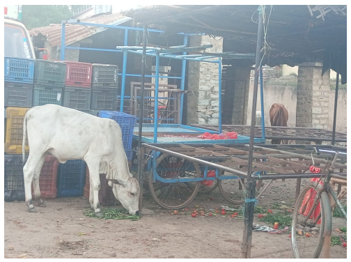
అక్కడ వ్యాపారాలు ఎలా చేసుకోవాలని వ్యాపారులు ఎలా చేసుకోవాలని వ్యాపారులు ఆవేదన వ్యక్తం చేస్తున్నారన్నారు. ఇక్కడ వ్యాపారులకు అనుగుణంగా అరుగులు ఏర్పాటు చెయ్యాలని వారు డిమాండ్ చేశారు. గతంలో వేసిన సిమెంట్ షెడ్లు దెబ్బతిని వర్షం వస్తే అమ్మకాలు బురదలో జరపాల్సిన పరిస్థితి

ఆంధ్ర ప్రగతి సంద్యాల నవంబర్ 12: అత్యుక్త పట్టణంలో వున్నది కూరగాయల మార్కెట్లూ లేకపోతే పశువుల మార్కెట్లూ చెప్పాలని సిపిఐ (యం యల్ ) లిబరేషన్ పార్టీ జిల్లా నాయకుడు గాలి రవిరాజ్ అధికారులను సూటిగా ప్రశ్నించారు అనంతరం అత్యుక్తూరు పట్టణం గాలి రవిరాజ్ మాట్లాడుతూ గత ప్రభుత్వంలో మోడల్ సంతలని చెప్పి వ్యాపారుల ఆశలను కలగానే మిగిల్చారని నూతన హామీని విస్మరించినందుకే కానీ ప్రభుత్వాలూ మారిన వ్యాపారులకు ప్రజలకు అవస్థలు పడుతున్నారని వారు విమర్శించారు. మార్కెట్ సంతలలో ఎడాదికి ఎనిమిది లక్షల రూపాయలు ఆదాయం వున్న మౌలిక వసతులు కల్పించడంలో అధికారులు విఫలమయ్యారన్నారు. ఇక్కడ సుమారు కొన్ని విండ్ల కిందట ఏర్పాటు చేసిన రేకుల షెడ్లు దెబ్బతిని వర్షాకాలంలో ఇక్కడి వ్యాపారుల కూరగాయలు తడిసి పోతున్నాయని అలాంటిప్పుడు