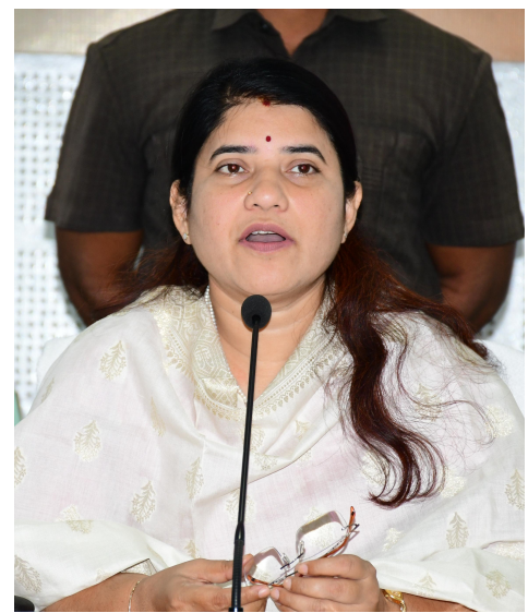
భూసేకరణ, తదితర పారామీటర్ల ప్రగతిలో వెనుకబడి ఉన్నామని కలెక్టర్ ఈ సందర్భంగా తెలిపారు.జిల్లాలో సిమెంట్ రోడ్ల నిర్మాణ పనులకు సంబంధించి 1026 పనులలో 284 మాత్రమే గ్రౌండింగ్ అయ్యాయని నిర్మాణాల ప్రగతి ఆశించిన

మెరుగైన ఫలితాలు సాధించాలన్నారు. సచివాల ఇంజనీరింగ్ అసిస్టెంట్లు ఉన్నత విద్యను అభ్యసించి ఇంజనీరింగ్ అసిస్టెంట్లుగా ఎంపిక అయ్యారని... చేయాలన్న తపన ఉంటే సాధ్యం కానిది ఏదీ లేదని చేపట్టిన సీసీ రోడ్ల నిర్మాణ పనులు శరవేగంగా పూర్తి చేసేందుకు పూర్తి స్థాయి శ్రద్ధ పెట్టాలన్నారు. అన్ని పారామీటర్లలో జిల్లాను మొదటి ఐదు స్థానాల్లో ఉంచేందుకు ప్రయత్నించాలన్నారు. చేపట్టిన నిర్మాణ పనులను మొక్కుబడి రీతిలో కాకుండా పూర్తి చేయాలన్న తపనతో పనిచేసి మీ సామర్థ్యాన్ని నిరూపించుకోవాలని కలెక్టర్ ఆదేశించారు. పురమాయంచిన పనులు నిర్ణీత వ్యవధిలో పూర్తయితే ప్రయోజనం ఉంటుంది కానీ అలస్యంగా చేస్తే ఎలాంటి గుర్తింపు ఉండదని కలెక్టర్ పుస్తం చేశారు. అలాగే సిమెంట్ రోడ్ల నాణ్యత కాల్ పరిమితి 30 సంవత్సరాల ఉంటుందని నిర్మాణ పనుల నాణ్యతలో రాజీ పడకుండా పనులు చేపట్టాలని కలెక్టర్ తెలిపారు. రోడ్లతో పాటు సైడ్ డ్రైన్ లనుకూడా మంజూరు చేయడం జరిగిందన్నారు. జిల్లాలో చార్జికల్చర్ ప్లాంటేషన్, లేబర్ బడ్జెట్, అవార్ బడ్, వాటర్ హార్వెస్టింగ్ డ్రైక్టర్, జాతీయ రహదారుల