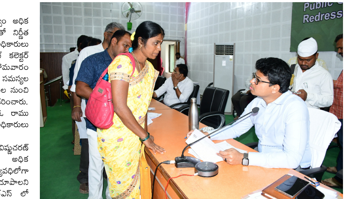
తాసిల్దార్ను జెసి ఆదేశించారు.

ఆంధ్ర ప్రగతి సంద్యాల, నవంబరు 25: వ్రజా ఫిర్యాదుల పరిష్కారంపై ప్రభుత్వం అధిక ప్రాధాన్యతనిస్తున్న నేపథ్యంలో నాణ్యతతో నిర్ణీత గడువులోగా పరిష్కరించేందుకు జిల్లా అధికారులు ప్రత్యేక శ్రద్ధ తీసుకోవాలని జాయింట్ కలెక్టర్ సి.విష్ణుచరణ్ ఆదేశించారు. సోమవారం కలెక్టరేట్లోని పిజిఆర్ఎస్ హాలులో వ్రజా సమస్యల పరిష్కార వేదిక ద్వారా జిల్లా సలమూల నుంచి వచ్చిన ప్రజల నుండి అర్జీలను స్వీకరించారు. జాయింట్ కలెక్టర్ తో పాటు డిఆర్ఓ రాము నాయక్, స్పెషల్ డిప్యూటీ కలెక్టర్లు, అధికారులు తదితరులు పాల్గొన్నారు.