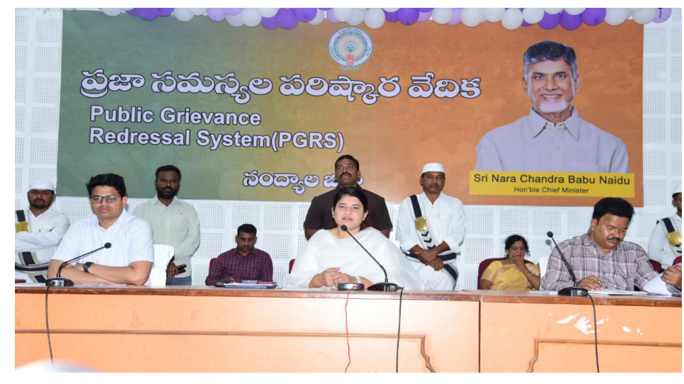
సిబ్బందికి స్థానికంగా సహకరించాలని కలెక్టర్ ఆదేశించారు. సచివాలయ సిబ్బందికి పెండింగ్ లో ఉన్న ఇంటిమెంట్లు మంజూరు చేయడంతో పాటు అర్హత సెలవులను సర్వీస్ రిజిస్టర్ లో సమాధు చేయాలన్నారు. అలాగే పనిచేయని ఫింగర్ ప్రింట్ డివైజ్ లను మరమ్మత్తులు చేసి వినియోగం లోకి తీసుకురావాలని కలెక్టర్ ఆదేశించారు. ముసాయిదా ఓటర్ల జాబితాని సిద్ధం చేశామని ఈనెల 9, 10 మరియు 23, 24 తేదీలలో ప్రత్యేక ఓటర్ల సవరణ కార్యక్రమం ద్వారా దరఖాస్తులు

చేయాలని కలెక్టర్ ఆదేశించారు. పెన్షన్ మొత్తాన్ని తిరిగి చెల్లించని నెరవేడ సచివాలయంలోని వెబ్సైట్ అప్డేట్ ను సస్పెండ్ చేశామన్నారు. అతనిపై క్రిమినల్ కేసులు కూడా సమాధు చేయాలని సంక్షేమ శాఖ డిడిని కలెక్టర్ ఆదేశించారు. సచివాలయ సిబ్బంది సిసిపి రూల్స్ కు లోబడి పని చేసేలా చర్యలు తీసుకోవాలని మున్సిపల్ కమిషనర్లు ఎంపీడీవోలను ఆదేశించారు. వారంలో రెండు పర్యాయాలు సచివాలయాలను పర్యవేక్షించి సిబ్బందికి తగు అదేశాలు జారీ చేయాలన్నారు. పెన్షన్ పొందుతున్న లబ్ధిదారులు మరణించి ఉంటే సంబంధిత వివరాలను నివేదికల్లో పొందుపరచాలన్నారు. వలసలు వెళ్లి లేదా అందుబాటులో లేక రెండు నెలల పెన్షన్ తీసుకోకపోయినా మూడో నెల మొత్తం పెన్షన్ పొందేందుకు అవకాశం కల్పిస్తామన్నారు. అటవీ ప్రాంత పరిధిలోని 48 చెంప గూడెంలలో 14 మండలాల సచివాలయ సిబ్బంది బృందాలను పైలట్ సర్వే నిమిత్తం పంపాలని సంబంధిత