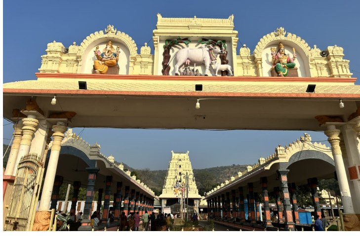
అలోచించకుండా 100 రూపాయలు చిల్లర ఇవ్వమని అడగా, వారు ఏమీ ఇచ్చి, 10 రూపాయలు తీసుకొని వట్టింతుకుండా తమ పని తాము

ఆంధ్ర ప్రగతి మహానంది నవంబర్ 03: కార్యక్రమం ప్రారంభం అవడంతో మొదటి సోమవారమైనందున మహానంది దేవస్థానానికి అధిక సంఖ్యలో భక్తులు పోటెత్తారు. ఇదే ఆనరాగా తీసుకొని భక్తుల దగ్గర నుండి నిలువ దోపిడీ చేస్తున్నారు. నేడు స్థానికులైన కొందరు కార్యక్రమం మొదటి సోమవారం అవడంతో దర్శనార్థమై టెంకాయ తీసుకొని లోపలికి వెళ్లిన అనంతరం, బివాలయం వక్కనే ఉన్న టెంకాయల బండర్ల దారులు, టెంకాయ కొట్టి ఇచ్చిన అనంతరం దక్షిణ అడిగారు అయితే భక్తులు తమ పంతుగా ఏమీ