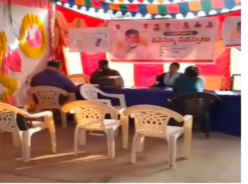
అందరూ ఉండి ప్రజలనుండి వివరాలు స్వీకరించాలి. కానీ రెవెన్యూ అధికారులు నిర్లక్ష్యంతో నామమాత్రంగా రెవెన్యూ సదస్సులు నిర్వహిస్తూ మధ్యాహ్నం వెళ్లిపోతున్నారు. ప్రతి గ్రామంలో ప్రతిరోజూ రెవెన్యూ సదస్సులో ఉన్నట్లు గ్రామంలో దండోరా కానీ, ప్రజలకు తెలియజేసిన దాఖలాలు లేవు. దీంతో ప్రజలకు గ్రామంలో రెవెన్యూ సదస్సులు జరుగుతున్నట్లు

రాష్ట్ర ప్రభుత్వం ఎంతో ప్రతిష్టాత్మకంగా గత ప్రభుత్వంలో జరిగిన తప్పులపై రైతుల సమస్యలను పరిష్కరించడానికి మొదలగా డి సి రెవ్యూ గ్రామసభలు నిర్వహించారు. రెండవసారి ఏ గ్రామంలో అయినా భూ సంబంధ సమస్యలపై సమస్యలు ఉంటే పరిష్కరించుకోవడానికి ప్రత్యేకంగా గ్రామసభలు నిర్వహించారు. కానీ బండి ఆత్మకూరు మండలంలో ప్రస్తుతం జరుగుతున్న గ్రామ సభలకు స్పందన కరువైంది. దీన్నిబట్టి చూస్తే రెవిన్యూ శాఖపై ప్రజలకు నమ్మకం లేదా అన్న అనుమానాలు కలుగుతున్నాయి. గత రెండు రోజులు నుంచి జరిగిన గ్రామసభల్లో బండి ఆత్మకూరు మేజర్ పంచాయతీ లో కేవలం ఆరు దరఖాస్తులు, శర్ల పాడు గ్రామంలో జరిగిన గ్రామసభలో 8 దరఖాస్తులు మాత్రమే రావడం ఇందుకు సాక్షిగా నిలుస్తున్నాయి. ముఖ్యంగా ఈ రెవెన్యూ సదస్సులు ఉదయం 9 గంటల నుండి సాయంత్రం ఐదు గంటల వరకు అధికారులు