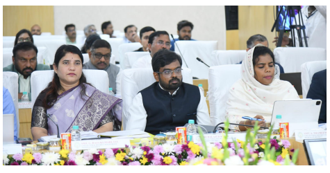
గుర్చివి ద్రోస్తు పంపి నాశనం చేయగలుగుతామని, గూగుల్తో ఒప్పందం రాష్ట్రంలోని యువతకు గుడ్ న్యూస్ అని చంద్రబాబు వ్యాఖ్యానించారు.

గూగుల్ ఎంవోయూతో విశాఖలో అధిక అభివృద్ధి జరుగుతుందని సీఎం చంద్రబాబు ఆశాభావం వ్యక్తం చేశారు. హార్డ్ వర్క్ ముఖ్యం కాదని.. స్మార్ట్ వర్క్ కావాలని.. ఓటీ దేశాన్ని కాపాడుతుందని, ప్రజాస్వామ్యం లేకపోతే నియంతృత్వం వస్తుందని సీఎం చంద్రబాబు అన్నారు. విద్యనంక పాలన తర్వాత ఏపీలో పునర్నిర్మాణం జరుగుతోందని, ప్రభుత్వ విజన్ , డైరెక్షన్ కలిపితే తెలియజేయడం ఈసమావేశం ముఖ్య ఉద్దేశమని అన్నారు. నాశనం జరిగిన దాన్ని తిరిగి నిర్మించినప్పుడు, హార్డ్ వర్క్ అవసరం అవుతుందన్నారు. క్రెసిస్లోనే అవకాశాలు ఉంటాయని.. దాన్ని తాను నమ్ముతానని.. ఎన్నికల కంటే ముందు తమకు ఓ అనుభవం ఉందని సీఎం అన్నారు. అయిదేళ్ళ తరువాత ఇండియాలో తప్పు చేసిన వారిని ఇంటికి పంపుతుందని, ఓటీ ఈ దేశాన్ని కాపాడుతుందని, ప్రజాస్వామ్యంలో కరెక్షన్ జరగనప్పుడు నియంతలు పుడతారన్నారు.