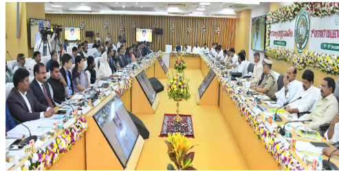
సీఎం చంద్రబాబు తెలిపారు.