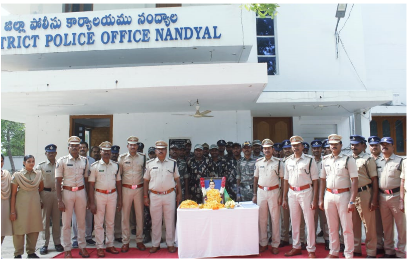
ఆంధ్ర ప్రగతి నంద్యాల డిసెంబర్ 15:

-జిల్లా పోలీస్ కార్యాలయంలో పాట్టి శ్రీరాములు చిత్రపటానికి పూలమాలవేసి ఘనంగా నివాళులు.