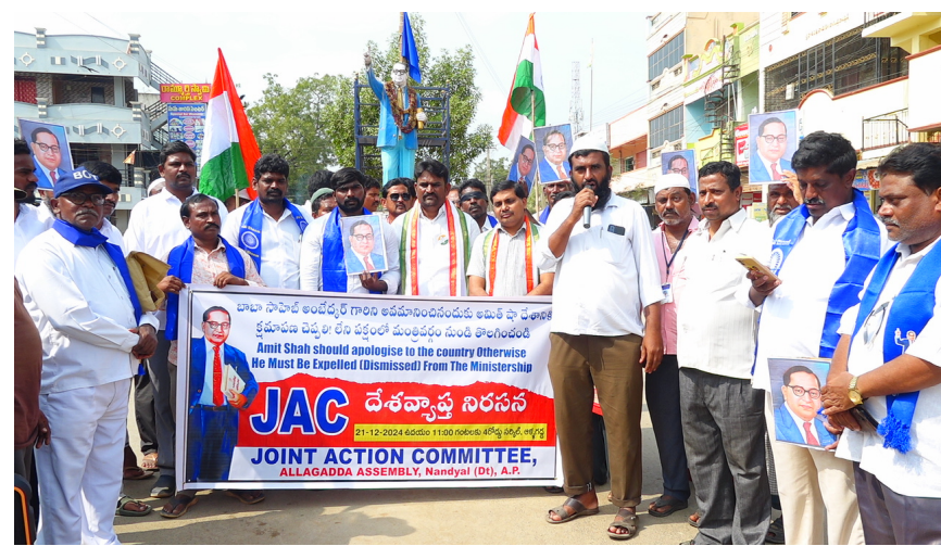
ఆంధ్ర ప్రగతి సంద్యాల డిసెంబర్ 21: