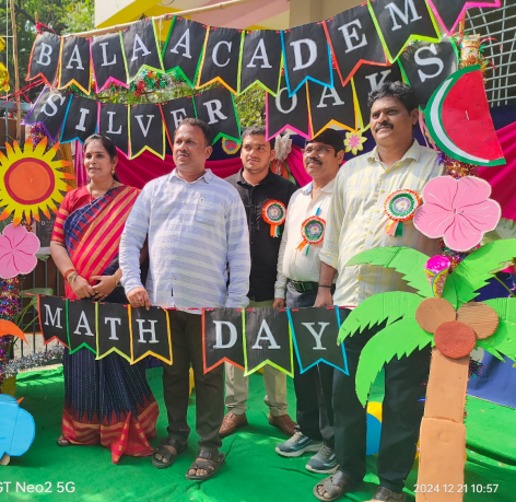
ఆంధ్ర ప్రగతి సంద్యాల డిసెంబర్ 21:

రచించిన దాకర్ బి.ఆర్ ఆంధ్రేంద్రర్ పై ఫలాలను అందించిన గొప్ప వ్యంగంగా మాట్లాడటం భారత మాహాదేవని అనంతరం ఆలీ ప్రజలను అవమానించినట్లు అన్నారు. ఇందియా ఫార్వర్డ్ బ్లాక్ నంద్యాల అణగారిన వర్గాలకు ప్రత్యేకంగా రాజ్యాంగంలో రిజర్వేషన్లు కల్పించి, ఎన్ ఎఫ్ ఐ నంద్యాల జిల్లా అధ్యక్షులు నేడు కోట్లజనాభా కు రాజ్యాంగ