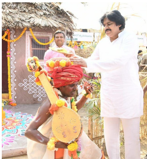
మాట్లాడారు. 'మీ బలం వలన రెండు లక్షల 8 కోట్లు పెట్టుబడులు వచ్చాయి. మిగతాది 2లో...