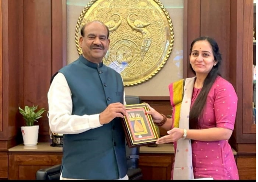
శ్రీశైల పుణ్య క్షేత్రంకు రావాలని లోక్ సభ స్పీకర్ ఓం ప్రకాష్ బిర్లా ను ఆహ్వానిస్తున్న ఎంపీ డాక్టర్ బైరెడ్డి శబరి

ఆంధ్ర ప్రగతి నంద్యాల జిల్లా ఏప్రిల్ 02: ఢిల్లీలోని పార్లమెంట్ ఆవరణలో లోక్ సభ స్పీకర్ కార్యాలయంలో బుధవారం స్పీకర్ ఓం ప్రకాష్ బిర్లాను నంద్యాల పార్లమెంట్ సభ్యురాలు, లోక్ సభ డీపీటీ డిప్యూటీ ఛీఫ్ లీడర్ డాక్టర్ బైరెడ్డి శబరి మర్యాద పూర్వకంగా కలిశారు. భూకైలాసంగా పిలువబడుతూ, అస్తాదశ శక్తి పీఠం, జ్యోతిర్లింగ క్షేత్రంగా విరాజిల్లుతున్న శ్రీశైల పుణ్య క్షేత్రంకు కుటుంబ సమేతంగా వచ్చి శ్రీ భ్రమరాంబ, మల్లికార్జున స్వామి వార్లను దర్శించుకోవాలని ఆహ్వానించారు. అనంతరం లోక్ సభ స్పీకర్ ఓం ప్రకాష్ బిర్లాకు శ్రీశైల భ్రమరాంబ మల్లికార్జున స్వామి వార్ల చిత్రపటం, లడ్డు ప్రసాదం ఎంపీ డాక్టర్ బైరెడ్డి శబరి అందజేశారు.